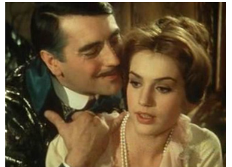
1964 LA RONDE de Roger Vadim avec Antonella Lualdi