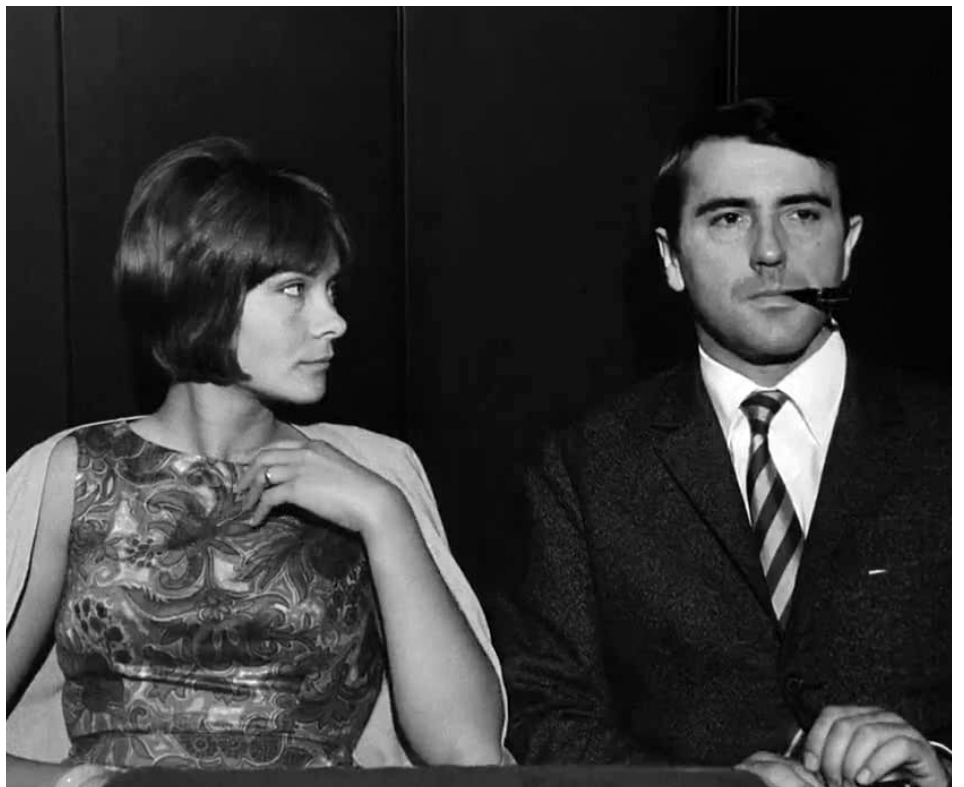
1964 UNE FEMME MARIÉE de Jean-Luc Godard avec Macha Méril