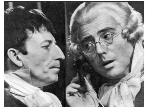
1966 BEAUMARCHAIS OU LES 60 000 FUSILS de Marcel Bluwal avec Henri Virlojeux