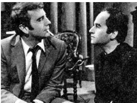
1969 L'INCONNU DE SÈVRES de Claude Deflandre avec Giani Esposito