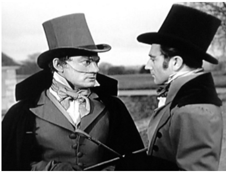
1952 NEZ-DE-CUIR d' Yves Allégret avec Jean Marais