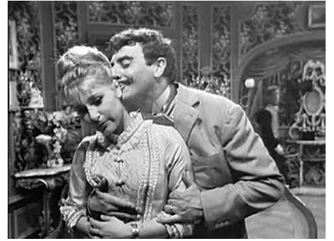
1963 CÉLIMARE LE BIEN-AIMÉ de René Lucot avec Marie-Claude Mestral