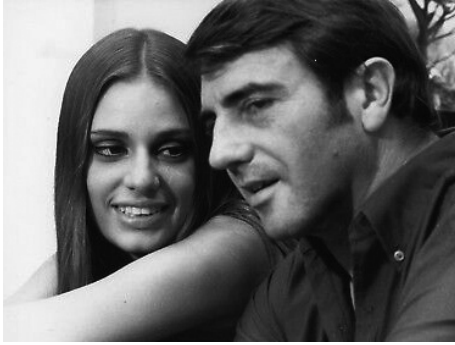
1966 UN CHOIX D'ASSASSINS de Philippe Fourastié avec Duda Cavalcanti