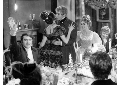
1966 ILLUSIONS PERDUES de Maurice Cazeneuve avec Yves Rénier, Élisabeth Wiener