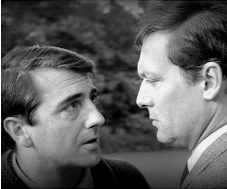
1963 LE FEU FOLLET de Louis Malle avec Maurice Ronet